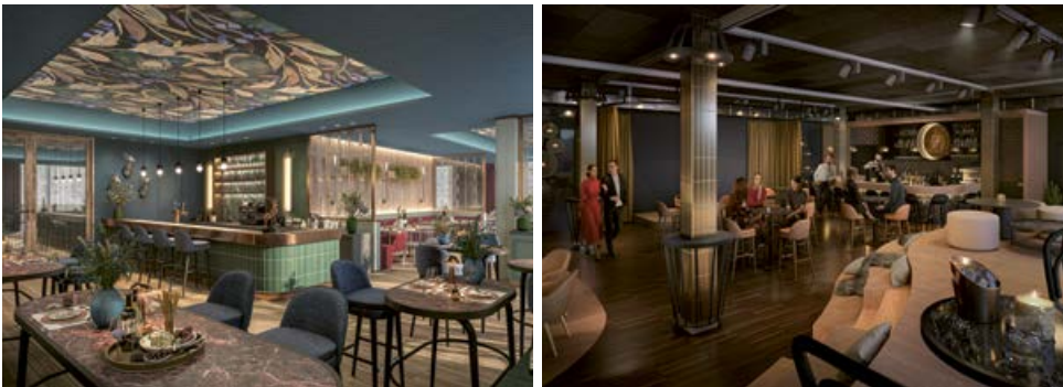
Die neue „Brasserie Leonis“ und der legendäre Club „Löwengrube“ bilden den perfekten Rahmen für ein erfolgreiches Abendprogramm.

verständlich können sie bei Bedarf auch verdunkelt werden und sind stets voll klimatisiert. Flexible Raumkonzepte mit Rückzugsmöglichkeiten, Foyers und verschiedene Restaurants bieten zusätzliche Optionen und ermöglichen Ihnen erfolgreiche Tagungen, Seminare und Events.